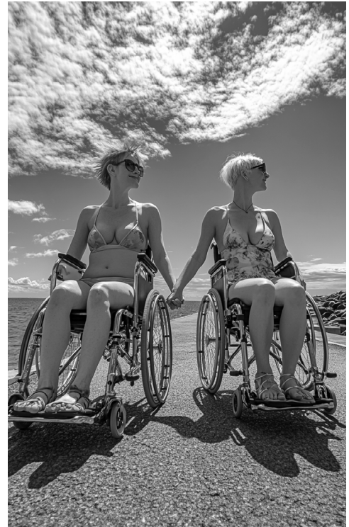
Abb. 3: KI-generierte Bilder von Paaren können in Abhängigkeit vom Prompt stereotyp (links) oder vielfältig sein //eigene Dargestaltung mit Midjourney Version Alpha, 12.11.2024