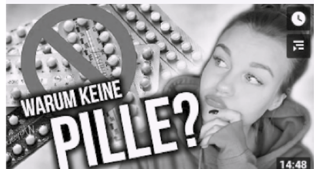
Abbildung 2: Beispiel für ein pillenkritisches Video auf YouTube von der Influencerin »Dagi Bee«, deren YouTube-Kanal knapp 4 Millionen Abonnements zählt.